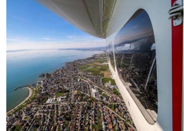
Jeder Fluggast hat einen Fensterplatz und uneingeschränkte Sicht nach draußen!