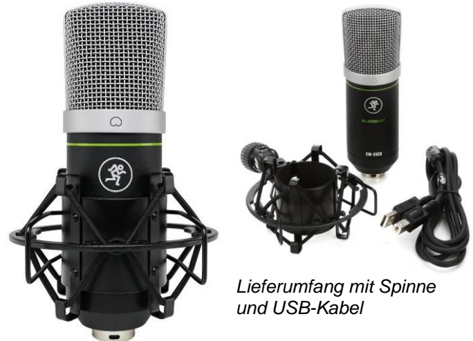
Lieferumfang mit Spinne und USB-Kabel

"Beim ersten Abhören waren wir über die Klarheit der Aufnahme erstaunt. Was uns besonders gefreut hat, dass so gut wie kein Grundrauschen vorhanden ist. Die Stimme des Testers wird warm aufgenommen und jedes Wort ist klar zu verstehen, selbst Flüstern wird hervorragend dargestellt. Das Mikro ist so preiswert, dass man das qualitativ sehr gute Ergebnis kaum glauben möchte."