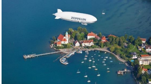
Eindrucksvolle Aussicht, hier ein Blick auf Wasserburg