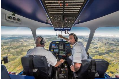
Hautnah bei den Zeppelin-Piloten. Es gibt keine Trennwand und kein Filmverbot!