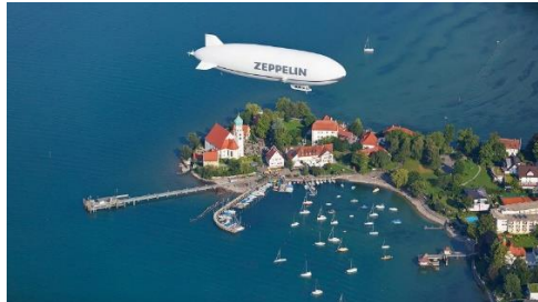
Eindrucksvolle Aussicht, hier ein Blick auf Wasserburg