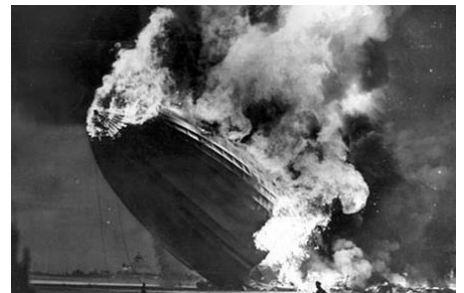
Die Katastrophe in Lakehurst. Heute nicht mehr möglich!