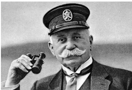
Graf von Zeppelin war der Erfinder der lenkbaren Luftschiffe

Um 1900 startete das erste lenkbare Luftschiff, erfunden vom Grafen von Zeppelin in Friedrichshafen. Erst nach seinem Tode vor rund 90 Jahren, begann der kurze Siegeszug der Luftschiffahrt, der mit der Katastrophe in Lakehurst endete und die große Zeit der Fernreisen mit den silbernen Himmels гигanten jäh beendete. Da heutzutage unbrennbares Helium als Füllgas verwendet wird, kann solch eine Katastrophe sich nicht mehr wiederholen.