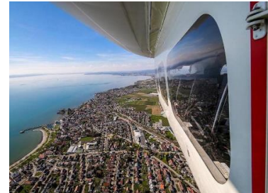
Jeder Fluggast hat einen Fensterplatz und uneingeschränkte Sicht nach draußen!