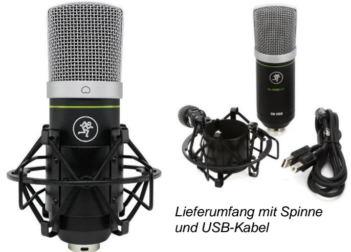
Lieferumfang mit Spinne und USB-Kabel

"Beim ersten Abhören waren wir über die Klarheit der Aufnahme erstaunt. Was uns besonders gefreut hat, dass so gut wie kein Grundrauschen vorhanden ist. Die Stimme des Testers wird warm aufgenommen und jedes Wort ist klar zu verstehen, selbst Flüstern wird hervorragend dargestellt. Das Mikro ist so preiswert, dass man das qualitativ sehr gute Ergebnis kaum glauben möchte."