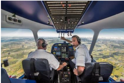
Hautnah bei den Zeppelin-Piloten. Es gibt keine Trennwand und kein Filmverbot!