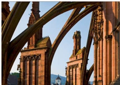
Die Freiburger Münsterbauhütte