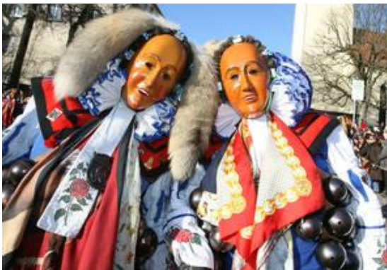
Links die Narros, rechts die Morbili - zwei von zahlreichen typische Figuren der Villingener Fasnet

Um 18 Uhr erleben wir vor dem Rathaus in Villingen, wie die Narros den Schlüssel und mit ihm die Amtsgewalt abholen. Anschließend sind wir dabei, wie die die Glonkis die Fasnet suchen, und sie am Bickentor finden. Ein kleiner Imbiss in einer der Zunftstuben lässt uns den Abend "überleben".