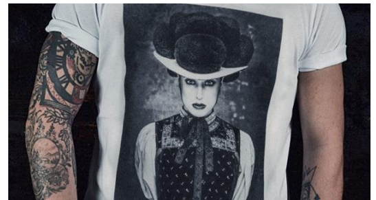
Ein ausgefallenes artwood-Motiv